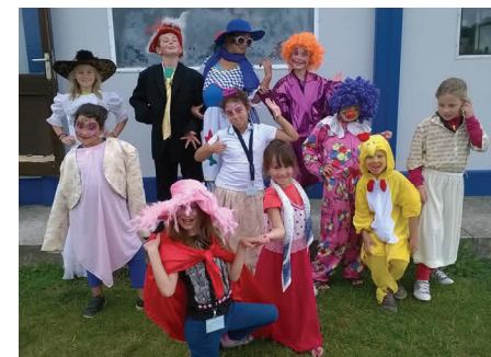
Promotiefoto's van deze activiteiten kunnen gepubliceerd worden. Bij bezwaar: info@sportmelle.be

Van ieder kind onder de twaalf jaar zal je na de zomer een gebruiksaanwijzing krijgen hoe je het fiscaal attest kan afprinten.